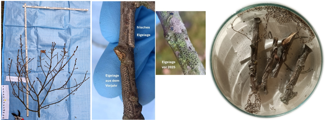
Abb. 2: links: Vermessung der Probereiser und Bonitur der Eigelege; Mitte: Unterscheidung der Eigelege nach dem Alter; rechts: Registrieren des Larvenschlupfes für die Eigelege eines Probezweiges

Falls von einem EPS-Befall durch die Brennhaare der Raupen eine Gefährdung für Menschen ausgeht und damit Gefahren für die öffentliche Sicherheit oder Ordnung vorliegen, sind die Ortpolizeibehörden für die Anordnung eines entsprechenden Bescheides gegenüber dem Eigentümer des Grundstückes zur Gefahrenabwehr zuständig.